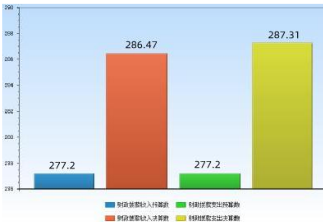
图 3：财政拨款收支预决算对比情况（单位：万元）

本单位 2020 年度一般公共预算财政拨款收入 286.47 万元，完成年初预算的 103.3%，比年初预算增加 9.27 万元，决算数大于预算数主要原因是有调入人员，工资增加了；本年支出 287.31 万元，完成年初预算的 103.7%，比年初预算增加 10.11 万元，决算数大于预算数主要原因是主要是有调入人员，工资增加了。