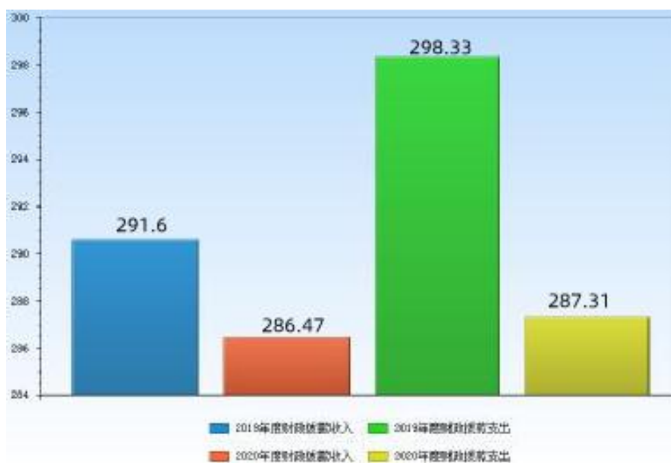
图 2：2019-2020 年财政拨款收支情况（单位：万元）

款，其中本年收入 286.47 万元，比 2019 年度减少 4.13 万元，降低 1.4%，主要是业务减少，财政拨款收入也减少了；本年支出 287.31 万元，比 2019 年度减少 11.02 万元，降低 3.7%，主要是业务减少，商品和服务支出也减少。