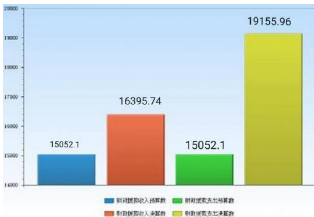
图 5：财政拨款收支预决算对比情况（单位：万元）

本单位 2020 年度一般公共预算财政拨款收入16,395.74 万元，完成年初预算的 108.9%，比年初预算增加 1,343.64 万元，决算数大于预算数主要原因是：增加市级救灾储备项目结转资金；本年支出 19,155.96 万元，完成年初预算的 127.3%，比年初预算增加 4,103.86 万元，决算数大于预算数主要原因是增加市级救灾储备项目结转资金支出。