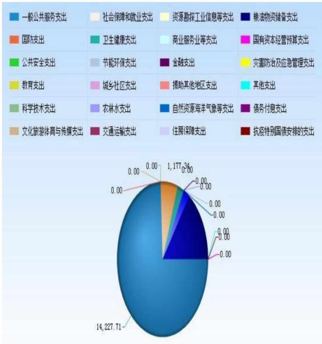
图 6: 财政拨款支出决算结构 (按功能分类)