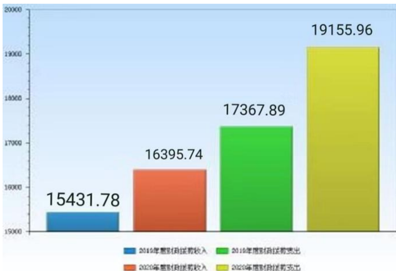
图 4：2019-2020 年财政拨款收支情况（单位：万元）

本单位 2020 年度形成的财政拨款收支均为一般公共预算财政拨款，其中本年收入 16,395.74 万元，比 2019 年度增加 963.96 万元，增长 6.3%，主要是增加市级救灾储备项目结转资金；本年支出 19,155.96 万元，比 2019 年度增加 1,788.07 万元，增长 10.3%，主要是增加市级救灾储备项目结转资金支出。如下图：