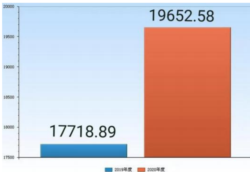
图 1：2019-2020 年收支总计对比情况

本单位 2020 年度收、支总计（含结转和结余）19,652.58 万元。与 2019 年度决算相比，收支各增加1,933.69 万元，增长 10.9%，主要原因是财政局拨付救灾物资储备款，作为年初结转结余调增。